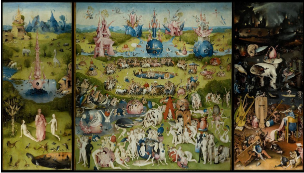
Hieronymus Bosch - Le Jardin des Délices Terrestres

Écrire sur tes erreurs et comment les résoudre.