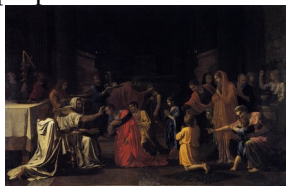
La confirmation – Nicolas Poussin