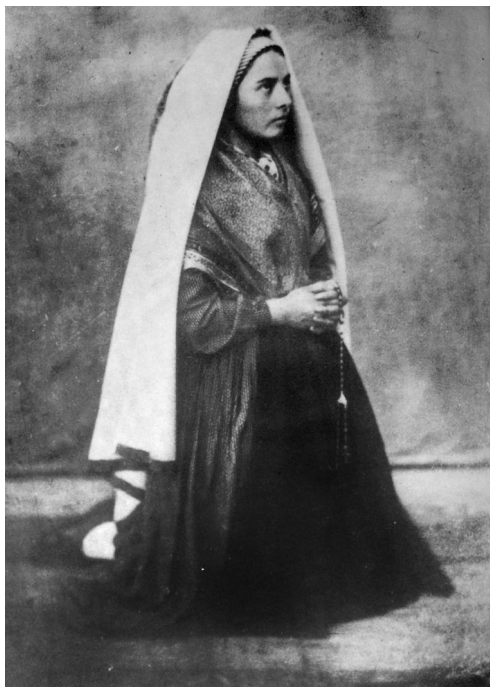
Bernadette Soubirous en train de prier