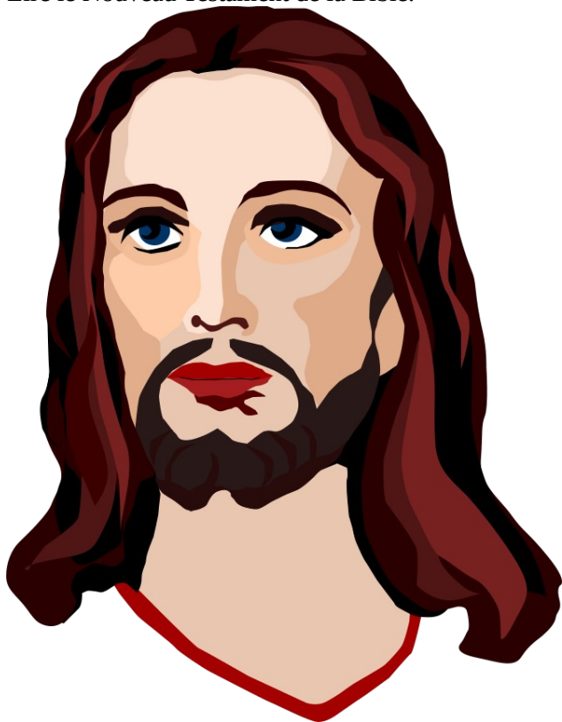
Jésus Christ occidental