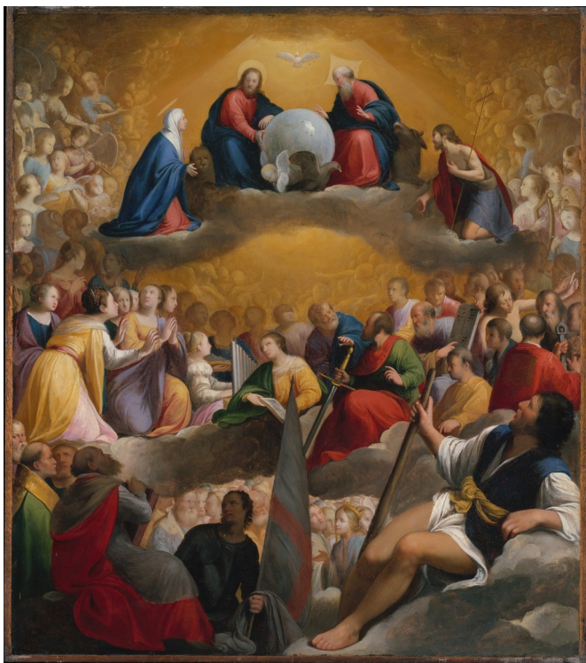
Le paradis est souvent représenté avec des humains - Carlo Saraceni