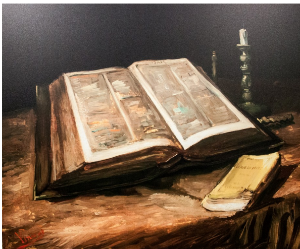
Van Gogh – La Bible

Rejoindre l'église pour lire avec eux la Bible.