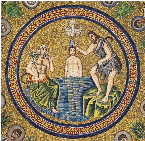
Le Baptême du Christ – Ravenne - Italie