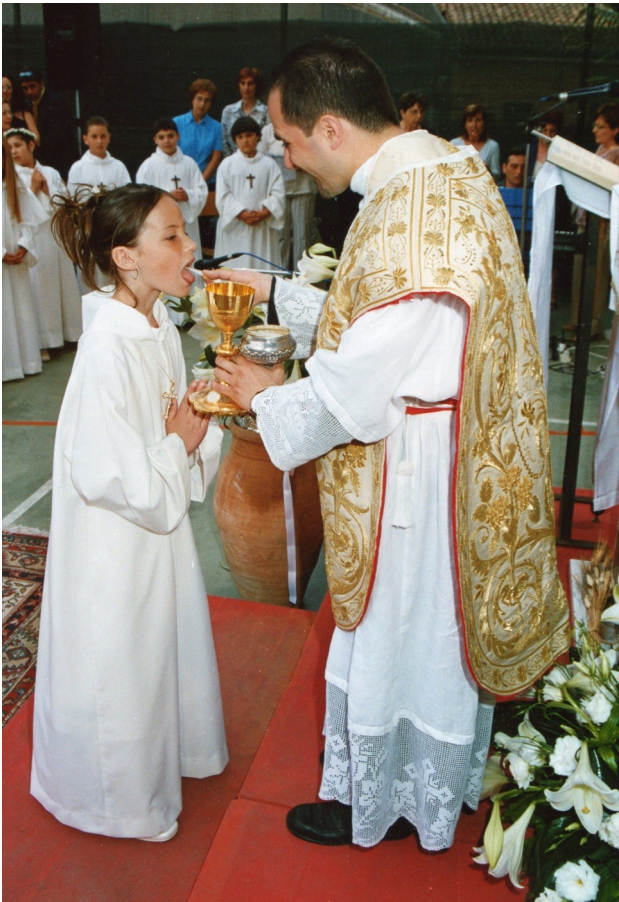
La communion d'une future adolescente