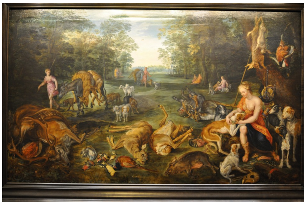
Brueghel et van Balen– La matière s'organise