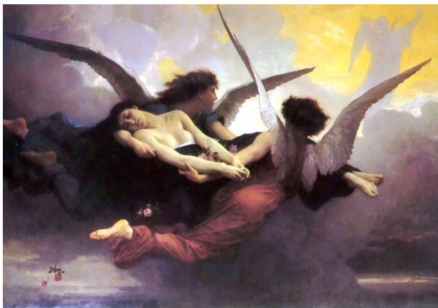
William-Adolphe Bouguereau Âme apportée au paradis