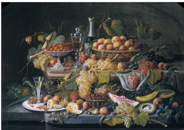
Severin Roesen – Tout ça pour nous !